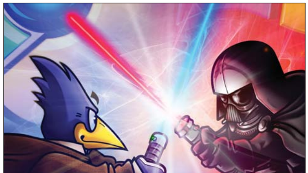
Fusce ac tellus sit amet magna rhoncus elementum. Aenean eu convallis est. Sed pharetra, dui sit amet volutpat.