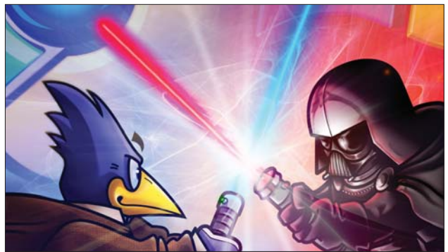
Fusce ac tellus sit amet magna rhoncus elementum. Aenean eu convallis est. Sed pharetra, dui sit amet volutpat.