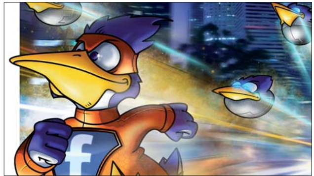
Fusce ac tellus sit amet magna rhoncus elementum. Aenean eu convallis est. Sed pharetra, dui sit amet volutpat.

Etiam fermentum hendrerit orci ut gravida. Aliquam a massa turpis, a commodo purus. In at elit diam, vitae pretium diam. Maecenas facilisis, elit tempus faucibus ultrices, lorem purus fringilla neque, eget consectetur ligula dui at nisi. Fusce vehicula facilisis malesuada. Donec sed metus quis leo adipiscing interdum nec sed justo. Quisque tristique ornare velit a fringilla. Sed volutpat molestie sem, eu pellentesque nisi varius ac. Suspendisse potenti. In gravida imperdiet neque, in facilisis augue mollis a. Aliquam